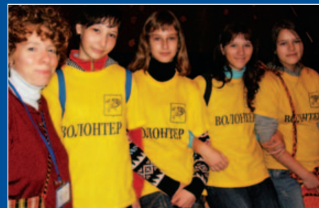
Małopolskie Towarzystwo Oświatowe PROJEKT: Aktywni Młodzi Przyszłości Ukrainy Wolontariuszki na Targach Pracy w Charkowie, Ukraina 2008