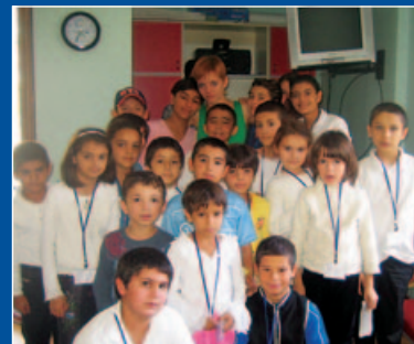
Fundacja Gajusz Program wolontariat polska pomoc, Armenia 2008

W Moldowie zniszczeniu uległo kilkaset budynków mieszkalnych, ponadto poważne szkody dotknęły uprawy rolne. W związku ze skutkami powodzi oraz w nawiązaniu do apelu ogłoszonego przez Międzynarodową Federację Stowarzyszeń Czerwonego Krzyża i Czerwonego Półksiężyca, Polska przekazała 0,5 mln PLN na działania objęte apelem. Środki zebrane w odpowiedzi na apel pomocy Moldawskiemu Czerwonemu Krzyżowi w zapewnieniu tymczasowych schronień oraz dostępu do wody pitnej dla poszkodowanej ludności.