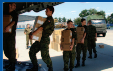
Pomoc humanitarna dla Gruzji: środki medyczne i opatrunkowe Zaladunek samolotu CASA 295M, Warszawa 2008