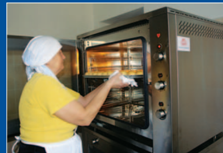
Fundacja im. Księcia Konstantego Ostrogskiego PROJEKT: „Otwarte szanse” - aktywizacja i wsparcie grup społecznych zagrożonych marginalizacją; Mini-piekarnia w Grodnie, Białorus 2008