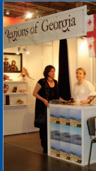
Fundacja Edukacji Międzykulturowej PROJEKT: Rozwój agroturystyki w Pankisi i Dżawacheti Międzynarodowe Targi Turystyczne Tour Salon 2008 w Poznaniu